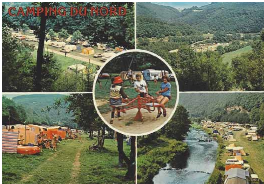
Camping du nord, Goebelsmühle