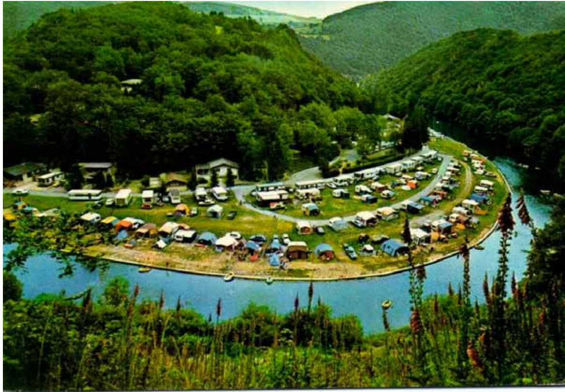
Camping Bel Air Bourscheid-plage