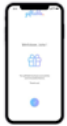
Go back, now, you have made someone's day