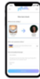
Add a personalized message